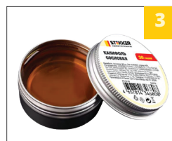
3 удобная упаковка