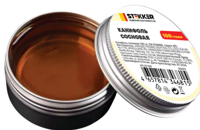
APL10-100 арт. 50073