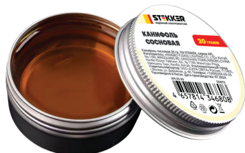
APL10-20 арт. 50072